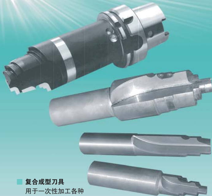
■ 复合成型刀具 用于一次性加工各种机械零部件

公司于 2005 年通过 ISO9001:2000 的认证, 2007 年被评为上海市先进技术企业荣誉称号, 公司汇集了中国一流的超硬领域专业生产技术人员, 经验丰富的德方管理人员, 秉承了德国企业一贯的严谨作风, 并配合完善的售前售后服务, 真正成为您身边的超硬刀具专家。