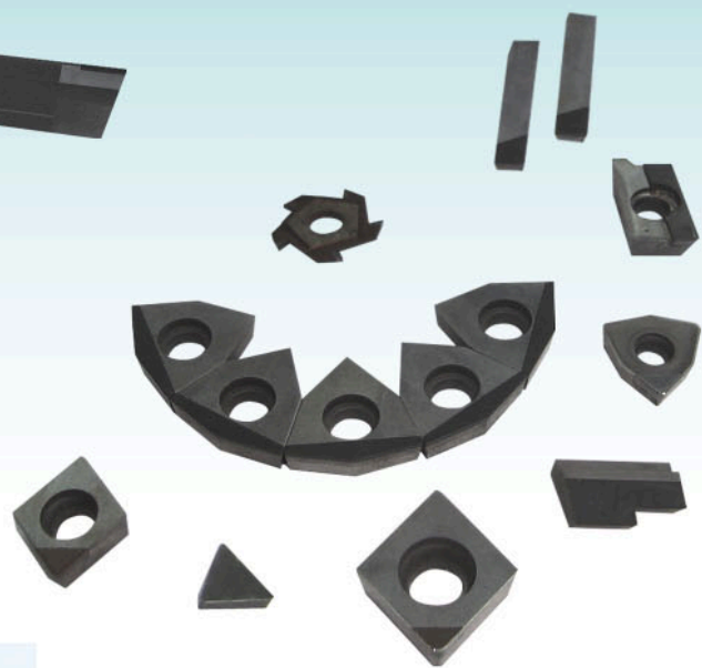
■ 各种非标刀具和非标刀片