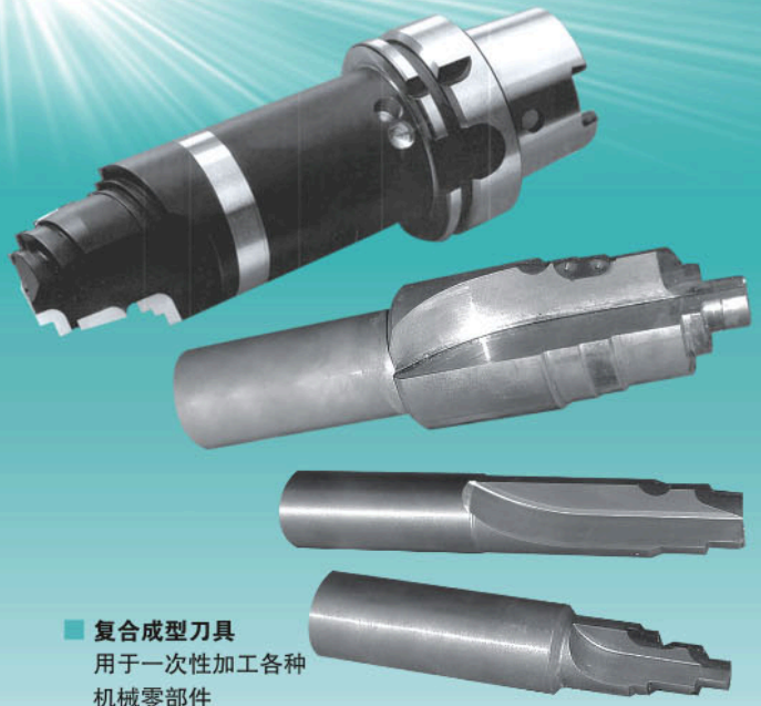
■ 复合成型刀具 用于一次性加工各种机械零部件

公司于 2005 年通过 ISO9001:2000 的认证, 2007 年被评为上海市先进技术企业荣誉称号,公司汇集了中国顶尖的超硬领域专业生产技术人员,经验丰富的德方管理人员,秉承了德国企业一贯的严谨作风,并配合完善的售前售后服务,真正成为您身边的超硬刀具专家。